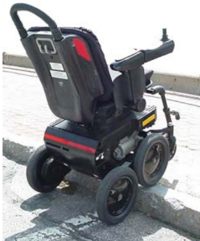
図2 4輪機能による段差越え

4輪機能は4輪のパワーベースによって駆動するモードで、主として戸外の泥地、草地、砂利などでの走行を想定している。ジャイロによる制御が利いているので、127mmまでの段差乗り越え、10度までの斜路の走行が可能である。