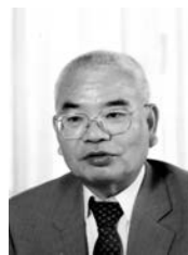
山内 繁 (Shigeru Yamauchi)

早稲田大学研究推進部参与、日本生活支援工学会顧問。昭和 37 年東京大学工学部卒。平成 4 年から国立身体障害者リハビリテーションセンター研究所長、平成 17 年より早稲田大学人間科学学術院特任教授、平成 22 年より現職、ISO/TC173 日本代表、ISO/TC173/WG8 コンビーナ、ISO/TC173/SC7 議長、